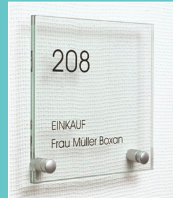
TOSCANA Türschild in verschiedenen Größen lieferbar, 2- oder 4-Loch- Ausführung