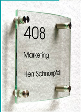
TOSCANA Türschild Größe: 150x150 mm 4-Loch-Ausführung, Glas leicht gewölbt